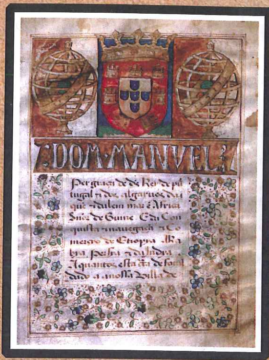
Imagem do frontispício do Foral Manuelino de Póvoa e Meadas _ Comemorações dos 500 Anos